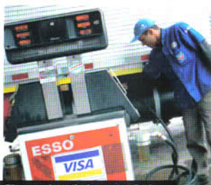
Filtragem de partículas e retenção de água, além de checagem periódica dos banheiros, faz parte do pacote implementado pela Esso para alavancar as vendas em seus postos de rodovias

A Ipiranga também conta com uma rede de serviços diferenciados para motoristas nas rodovias. São 657 postos espalhados pelas regiões Sul (292),