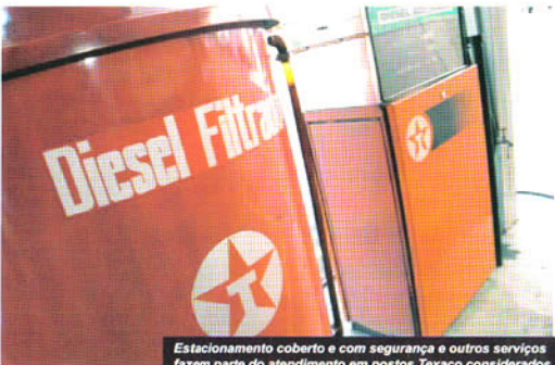
Estacionamento coberto e com segurança e outros serviços fazem parte do atendimento em postos Texaco considerados com grandes estruturas para atender motoristas de caminhão