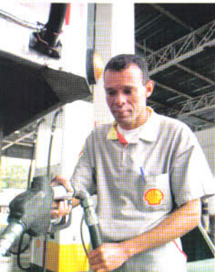
Diante da certeza de que os motoristas de caminhão sabem reconhecer a qualidade dos produtos e dos serviços, a Shell se mantém sempre em ação em relação ao atendimento

Os postos de rodovias com bandeira Texaco também não ficam atrás quando se trata de prestar atendimento diferenciado para o motorista de caminhão. A rede conta com 33 postos com grandes estruturas para atender carreteiros, nas quais se incluem estacionamento, diesel filtrado, lojas, troca de carta-frete para empresas