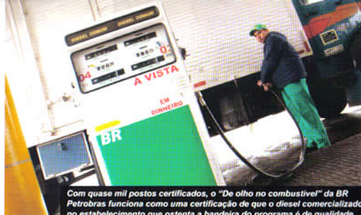
Com quase mil postos certificados, o "De olho no combustível" da BR Petrobras funciona como uma certificação de que o diesel comercializado no estabelecimento que ostenta a bandeira do programa é de qualidade

gem nas estradas. "Os carreteiros têm uma visão muito clara sobre a qualidade dos produtos e serviços oferecidos nas rodovias pelos postos, por isso vamos continuar trabalhando para atender plenamente estes profissionais", disse o executivo.